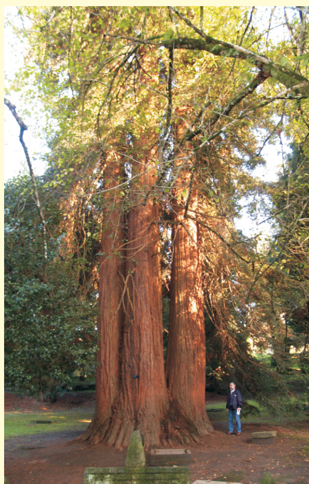
Secuoia vermella Pazo Soutomaior (Pontevedra). Ten máis de 100 anos. Mide 39 m de altura e 9,25 m de perímetro troncal.