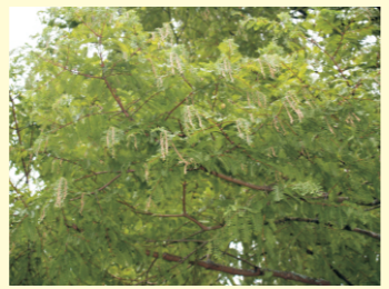
Metasecuoia do Pazo de Lourizán. Pontevedra. Mide 28 m de altura

Metasequoia glyptostroboides É unha árbore de folla caediza orixinaria do suroeste de China.