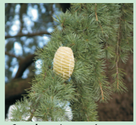
Cono do cedro coa súa típica forma globosa.

Son orixinarios das montañas de Asia Occidental e norte de África. Caracterízanse por ter dúas clases de acículas, unhas que se insiren illadas sobre ponlas longas e outras agrupadas en feixes sobre ponlas curtas. As piñas desintégrense na árbore ao madurar.