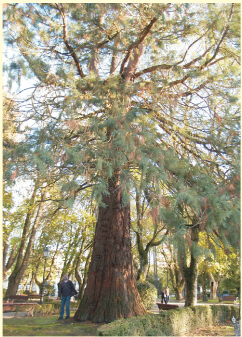
Secuoia xigante. Parque Rosalía de Castro (Lugo). Hai varios exemplares. O máis grande mide 31,5 m de altura.