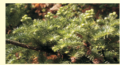
Cuningamia do Parque Caldas de Reis. Mide 31 m de altura.

Cunninghamia lanceolata Árbore orixinaria da China, de copa columnar irregular. Os conos son ovoides e pequenos. As máis grandes atópanse no Pazo de Gondomar e miden arredor de 40 m.