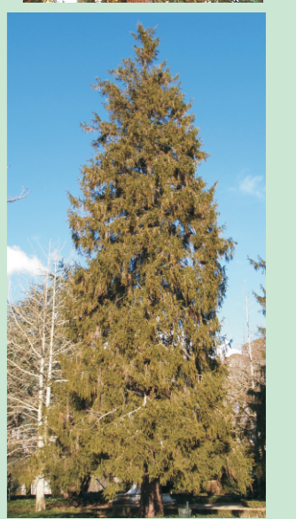
Picea común Castelo de Soutomaior.