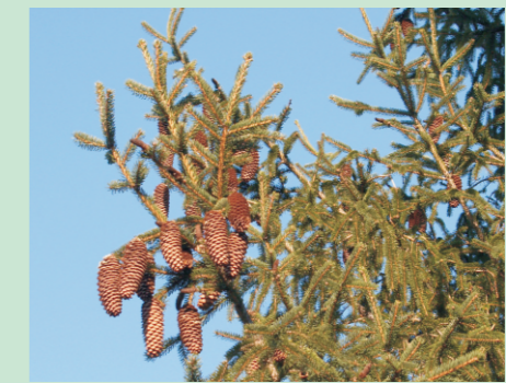
Detalle dunha ponla de picea coas piñas colgantes.