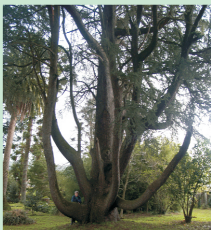
CEDROS AZUIS ( Cedrus atlantica , variedade Glauca ). Pazo de Gandarón (Pontevedra). Miden 26 a 30 m de altura.

Cedrus deodara. Xardíns de Vincenti (Pontevedra). Teñen arredor de cen anos e miden 23 a 27 m de altura.