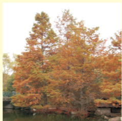
Taxodio do Xardín de Artime (Vilagarcía). Mide 33 m de altura e 5,80 de perímetro troncal e posiblemente sexa un dos máis grandes de España.